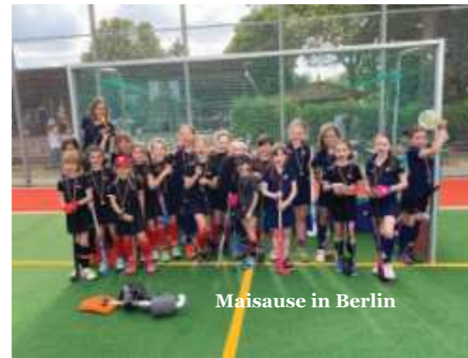
Maisause in Berlin