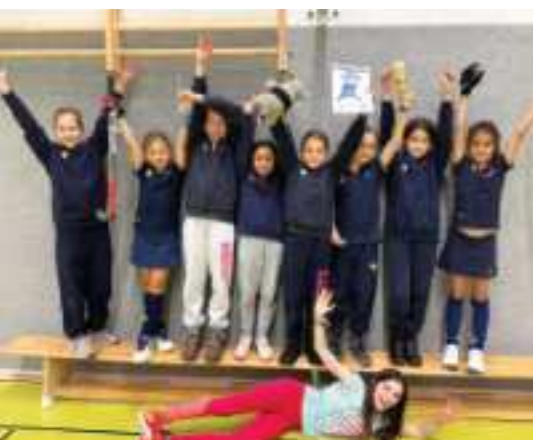
Turnier beim MTV Eintracht Celle – wieder 3. Platz!