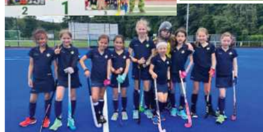
Bilder oben: starke 3. Plätze beim 13. Rübezahl-Cup (l) bei der Köpenicker Hockey-Union e.V. in Berlin und beim Summercup der Potsdamer Sport-Union 04 (r) an einem heißen Juni-Wochenende!