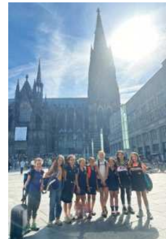
Bild unten: auf dem Rückweg aus Köln - die Mädels haben einen tollen 6. Platz gemacht beim Echte Fründe Cup bei Blau-Weiss Köln!