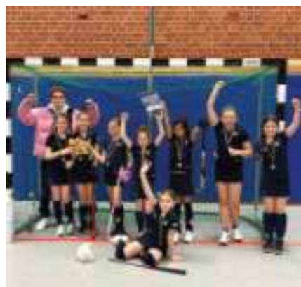
Richtig starker 3. Platz beim Girls Cup in Kiel im Februar 2025