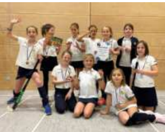
2. Platz beim 1. Falken Cup in Falkensee

Ab Oktober startet beim Hockey die Hallensaison. Die Hallensaison bringt ganz eigene Herausforderungen mit sich – schnelleres Spiel, kleineres Spielfeld, neue Taktiken. Auch hier haben sich die Mädels an den Spieltagen und bei Turnieren sehr gut geschlagen. Die Turniersaison hat im November mit Turnieren in Falkensee und Celle gestartet.