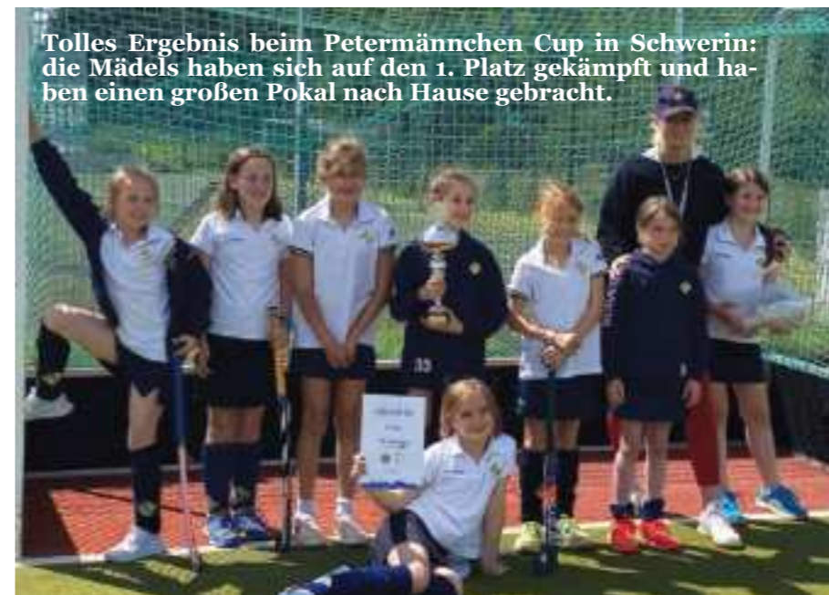
Tolles Ergebnis beim Petermännchen Cup in Schwerin: die Mädels haben sich auf den 1. Platz gekämpft und haben einen großen Pokal nach Hause gebracht.