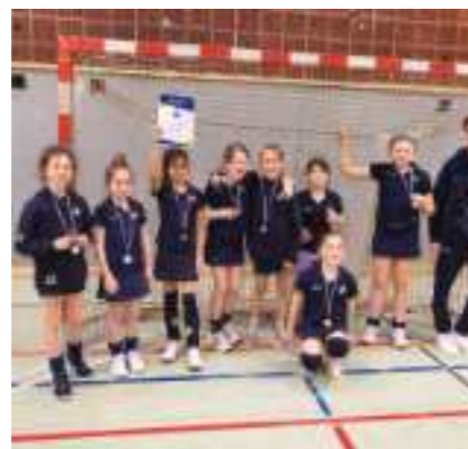
Bei einem tollen Hockey-Wochenende in Delmenhorst wurde der 4. Platz erreicht

Auch im hohen Norden findet die 5. Jahreszeit Einzug beim Hockey. Der Rahlstedter Hockey- und Tennis-Club e.V. hat zu Faschingsturnieren eingeladen. Team Regenbogen hat den 3. Platz gesichert, die Konfetti-Truppe ist nach vollem Einsatz knapp am Sieg vorbei geschlittert und auf Platz 2 gelandet! Dank der kreativen Verkleidung (danke an die Bruchis!) haben die Konfettis