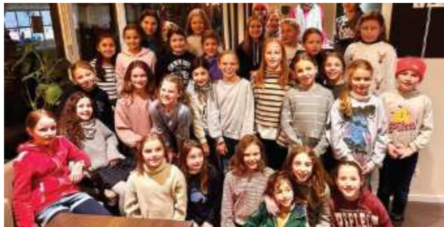
Weihnachtsfeier der wU10 in unserer Gastro (2024)